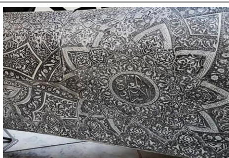
تفصيل (١) عبارة الإسراء والمعراج داخل نسق هندسي زخرفي

كما يبدو واضحاً أن الجذور الأعمق في هذا المنجز البصري هي زخارف الفن الإسلامي التي تمتاز بالدقة العالية في رسم المساحات الهندسية وفق حسابات رياضية بالغة الدقة وكذلك زخارف الرقش العربي المعروفة بزخارف (الأرابيسك)، إذ عدت هذه التجربة ( مازيراتي ) هي استكمال لفن الوشم على حسب ما كان للفنان من تجارب استفزازية في هذا المجال .