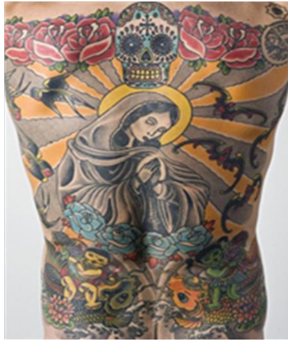
شكل (٣) الرجل الذي باع ظهره

لإعمال الوشم ، كما غرب تقنية الوشم التي هي بالاساس أسلوب وتقنية تغريبية ؛ لتنفيذ العمل الفني على الجسد البشرية ، فعمد إلى تغريب التغريب وبشكل مغاير من أجساد البشرية إلى أجساد الخنازير ، كما في الشكل (١) ، يشكل حالة من الإنفتاح الإسلوبي ، إذ يؤدي إنفتاح الفني النص التشكيلي لإيجاد رؤى أوسع بتعدد آليات إشتغال معاصرة يكون العمل الفني منفتحاً عبر مشاكسة الفنان الأدائية للمتلقى بعروضه البصرية المنفتحة لم يألفها المتلقى من قبل ، فبعد قيام الفنان تربية الخننازير وبحكم كونه طبيب يقوم بتخديرها وحلقها ومن ثم وشمها ، وعند الانتهاء يبيع جلودها بأسعار مرتفعة ، ففي الشكل (٢) نجد في موضوع العمل إختراقاً لقدسسية الشخصية الدينية وهي صورة ( السيد المسيح عليه السلام ) ، نفذها على جسد حيوان ذات رتبة متدنية كالخنزير ، الذي تم تحريمه في الدين الإسلامي ، ورغم ذلك إستحصل على موافقة إدارة معرض طهران للفن المعاصر لعرضه ، ويُعدُّ هذا الوشم أحد خروقات الفنان الجنوبية المثيرة للجدل ، حيث نجد إختراق متعمداً آخر للإيقونة المقدسة ايضاً هي ( السيدة مريم العذراء عليها السلام ) وتغريبها عن قدسية وجودها المكاني كصورة تم وشمها على ظهر إنسان كما في (شكل ٣). حمل هذا العمل اسم ( الرجل الذي باع ظهره ) ، إذ أستهوى هذا العمل أحد رجال الأعمال فدعته رغبته لشراء جلد ظهر الموديل بعد موته بسعر خيالي ، كما إستهوى هذا العمل