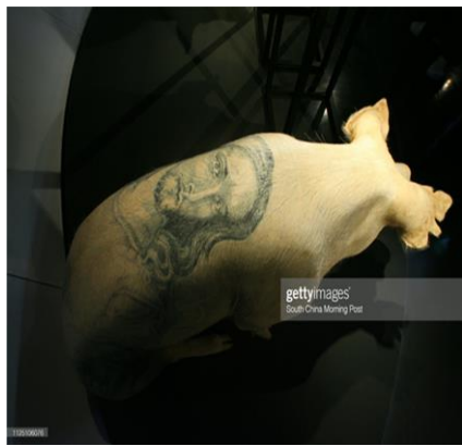
شكل (٢) وشم صورة السيد المسيح (ع) على جسد خنزير