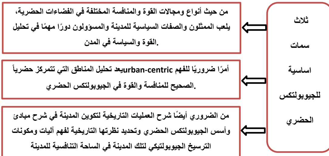
الشكل (٢): ثلاث سمات أساسية للجيوبولتكس الحضري.

والنتيجة هي أن قوة المدينة، والمنافسة الإقليمية والعالمية، والقيم البيئية الحضرية، والصراع الحضري، والسياسات المتعلقة بتنمية المدينة، والتاريخ، والثقافة الحضرية والعديد من العوامل الأخرى تشكل "الجيوبولتيك الحضري". الجيوبولتيك الحضري هو دراسة نظامية لتطور المدينة ونموها وشكلها وتصميمها وتشبيدها وأدائها وتطويرها مع مراعاة البنى الاجتماعية والاقتصادية والسياسية للمدينة وفي إطار منظومة تحليل القوى وأذرع القوة في المدينة. إن الأماكن والمواقع الجغرافية المختلفة لها قيم مختلفة حسب موقعها وخصائصها. إن مجموع هذه القيم التي تتأثر إلى حد كبير بالعوامل الجغرافية، يمكن مكاناً أو إقليمياً واحدة -وأماكنها وأقاليمها-، وعادةً ما تستخدم الأماكن والأقاليم هذه القوة لتطوير تغلبها وتأثيرها. كما أنه سيساعد على فهم أفضل لمدى القوة التي يتمتع بها المكان وما هي الوظائف والأدوار التي يمكن أن يلعبها في القضايا السياسية والاجتماعية والثقافية. بمعنى آخر، هناك علاقة بين تأثير أدوار الموقع والمنطقة الجغرافية و"قدر قوتها". أي أن الأدوار الأكثر وظيفية أو الأوسع تؤدي إلى أعلى للموقع الجغرافي. لأن التوسع الأكبر لهذه الوظائف يعكس درجة فعاليتها الأعلى مع المواقع والأقاليم الأخرى. على سبيل المثال، تعتبر المدن العالمية من الأماكن ذات الأداء العالي، خاصة من الناحيتين الاقتصادية والسياسية (Friedman, 1995).